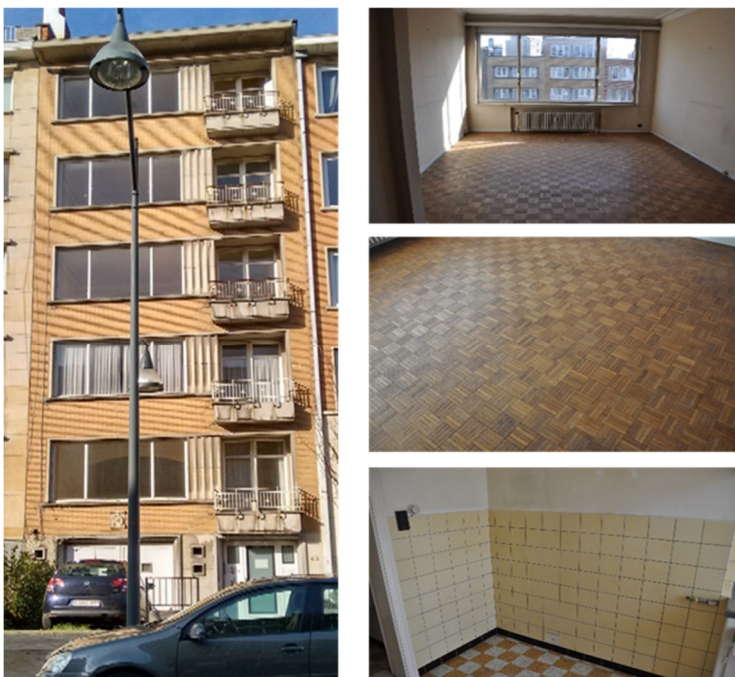
Zicht op het gebouw en het interieur vóór de renovatie

De enige plaats voor een container voor gescheiden afvalinzameling is de parkeerplaats in de voorplaats van het gebouw.