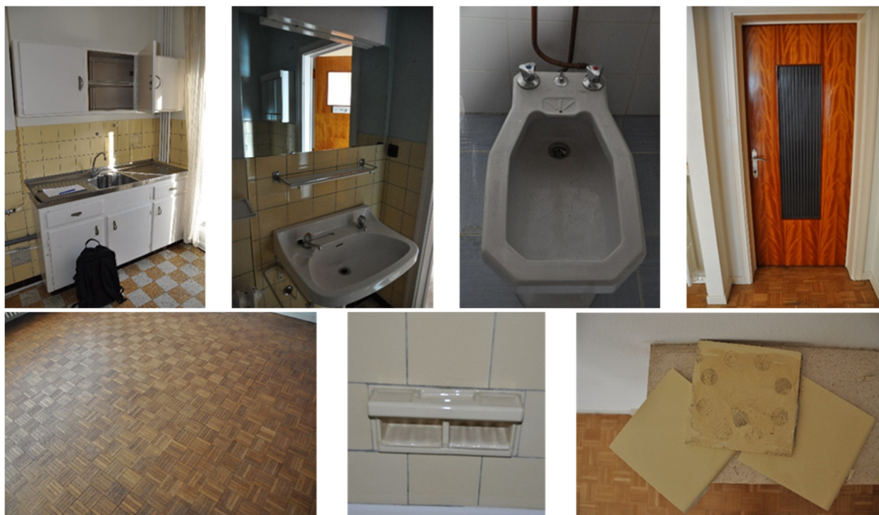
Herbruikbare elementen (van links naar rechts en van boven naar onder: keukenmeubels, badkamerset, bidet, houten deuren (al dan niet beglaasd), parket in massief hout, tegels en zeephouder)