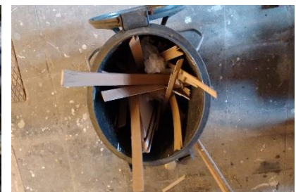
Déchets de bois