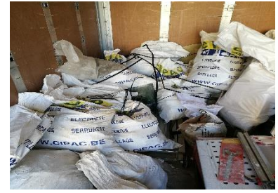
Sacs triés dans la camionnette