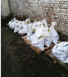
Sacs en attente d'évacuation