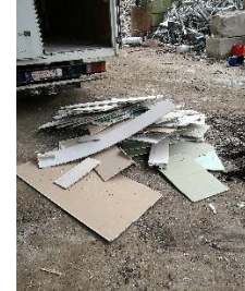
Déchets de plaque de plâtre triés et acheminés chez le collecteur