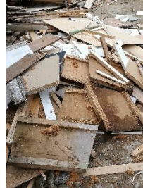
Déchets de bois en attente d'être acheminés vers le collecteur