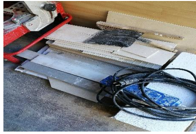
Chutes de carrelage triées dans la camionnette