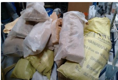
Déchets d'isolant en laine de bois

Certains déchets sont déjà massifiés dans l'entrepôt de l'entrepreneur.