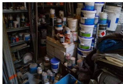
Déchets de pots de peinture