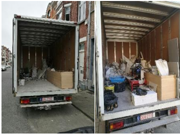
Camionnette servant de moyen de tri et de transport